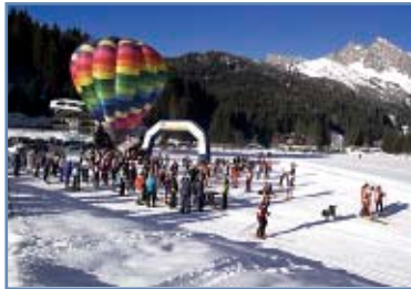
Centro fondo di San Martino

Note: innevamento programmato, utilizzo del centro fondo a pagamento