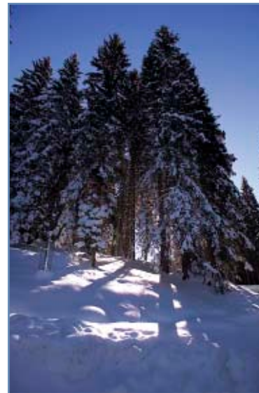
I boschi di Passo Rolle

A Passo Rolle (raggiungibile da San Martino anche con skibus) è possibile noleggiare l'attrezzatura per lo sci di fondo.