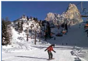
Pista “Ferrari 1”

La pista collega la stazione a monte con la stazione a valle della seggiovia omonima. La presenza di vegetazione ai lati la caratterizza rispetto alle altre piste di Passo Rolle.