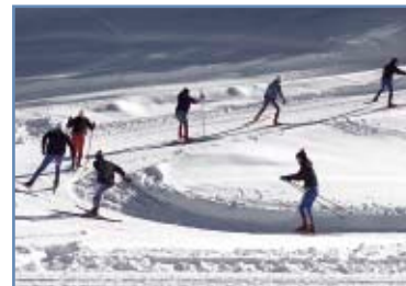
Centro fondo Passo Cereda