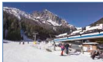
Seggiovia "Punta Ces"