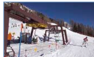
Seggiovia "Coston" (ritorno)