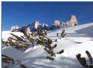
Neve con il Cimon della Pala

Il comprensorio sciistico di San Martino di Castrozza - Passo Rolle, ricompreso nel carosello Dolomiti Superski, vanta temperature mai troppo rigide e innumerevoli giornate di sole splendente.