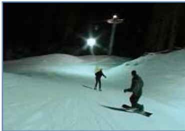
Pista “Colverde” di sera

La parte alta prevede due percorsi diversi, che poi confluiscono in un'unica pista. Quest'area è adatta anche in caso di maltempo e nebbia, perchè interamente nel bosco.