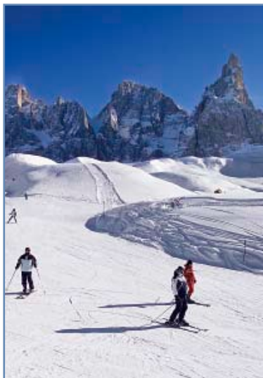
Sci a Passo Rolle

Accesso: si raggiunge Passo Rolle in auto (a 9 km da San Martino), seguendo la S.S. 50, Servizio di skibus. Al passo ampio parcheggio per auto camper e bus. Tutti gli impianti sono in prossimità dei parcheggi. Ampia scelta di ristoranti e bar.