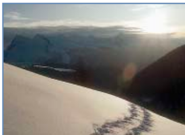
Neve a Passo Rolle