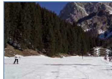
Pista “Pra’ delle Nasse”

Se volete avvicinarvi agli sport sulla neve, questo è il posto giusto dove cominciare.