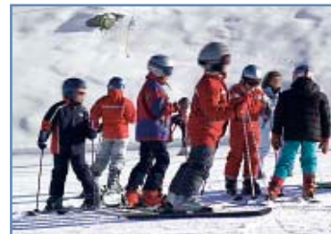
Pista “Baby Tognola”