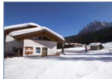
Centro fondo Passo Cereda

Passo Cereda 7,5 km:.. nera, 7.500 m., omologata FIS (dislivello totale m. 246, dislivello massima salita m. 50, quota più alta slm m. 1.397, quota più bassa slm m. 1.290, differenza quota m. 106).