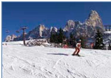
Pista “Ferrari 2”

La discontinuità della pendenza fa la felicità anche dello sciatore esperto.