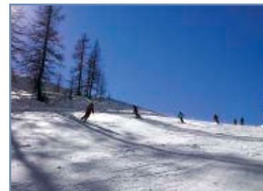
Pista “Tognola Tre”

La pista è un'ottima alternativa alla “Tognola Uno”, il tratto finale pianeggiante è poco adatto ai praticanti dello snowboard.