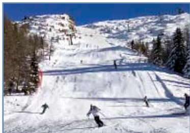
Pista “Paradiso 1”

La pista collega la stazione a monte con la stazione a valle della seggiovia Paradiso.