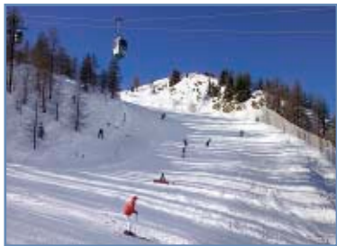
Pista “Tognola Uno”

Percorsi circa due terzi della pista, c'è una variante facile che permette di evitare l'ultimo tratto, molto ripido, adatto a sciatori esperti.