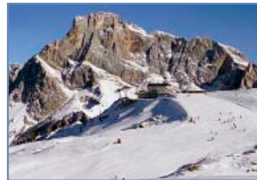
Partenza della pista “Rododendro”

È servita da una nuovissima seggiovia quadriposto ad agganciamento automatico, molto veloce.