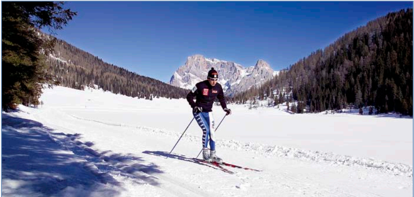
Allenamento sulla pista di fondo del lago di Calaita

Le piste sono regolarmente battute sia per la tecnica classica che per il passo pattinato.