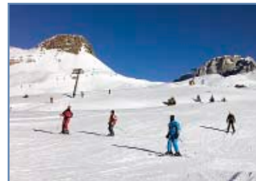
Pista “Rolle 1”

Alla partenza della sciovia si trova un punto vendita skipass.