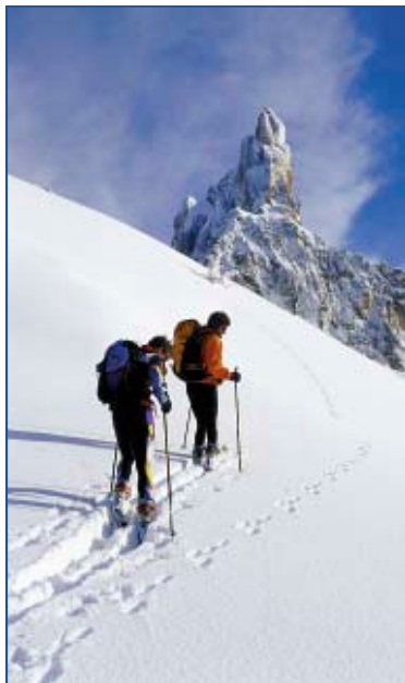
Sci alpinismo a Passo Rolle

Lo sci alpinismo richiede passione e allenamento ma ha il vantaggio di condurre chi lo pratica a immergersi in modo totale nella natura, lontano da confusione e rumori.