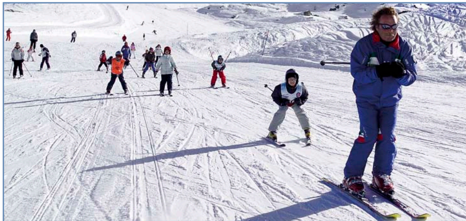
Bambini a scuola di sci