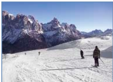
Pista “Tognola Uno”

Note: innevamento programmato. All'arrivo della pista sono disponibili: 2 noleggi e riparazione sci, deposito sci e biglietteria skipass; in partenza sono disponibili: self-service per regolazione sci, kinderland e baby area, punto di ritrovo maestri di sci