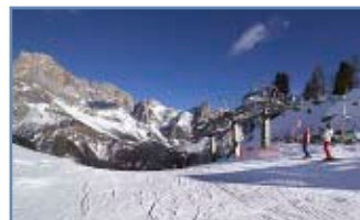
Seggiovia "Coston" (intermedia)