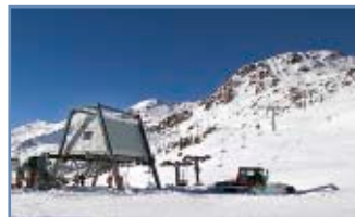
Seggiovia "Cima Tognola"