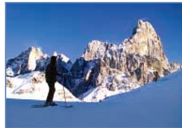
Pista “Fiamme Gialle”

È omologata FISL e FIS per Slalom e Slalom Gigante.