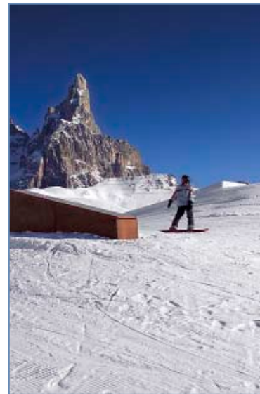
Rolle Railz Park

Impianti Castellazzo - Ivo Mich, tel. (+39) 348 3728502