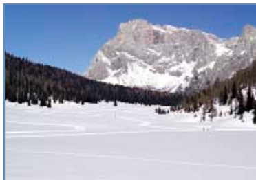
Pista del Lago di Calaita

Note: innevamento naturale, utilizzo della pista gratuito