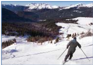
Pista “Paradiso 1”