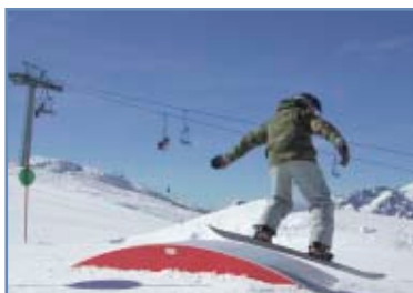
San Martino Snowpark

È situato lungo il Carosello delle Malghe, servito dalla Seggiovia Scandola e limitrofo all’omonima pista. L’area su cui si sviluppa è molto ampia ed esposta costantemente al sole. Inoltre è in parte dotato di innevamento programmato, che garantisce l’apertura delle strutture anche in caso di assenza di neve naturale.