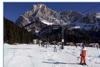
Sciovia "Pra' delle Nasse"