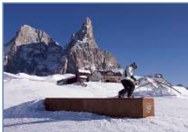
Rolle Railz Park

Sono presenti anche strutture per i più bravi: linee blu, rosse e nere che garantiscono una progressione tecnica adeguata per ogni livello di difficoltà.