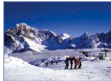
Partenza della pista Cristiana