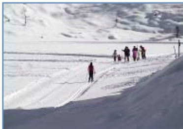
Pista del Lago di Calaita

Il tracciato corre su prati pianeggianti o con pendii modesti ed in parte sul lago ghiacciato in uno dei luoghi più belli del Parco Naturale Paneveggio Pale di San Martino. Accesso alla pista libero e gratuito.