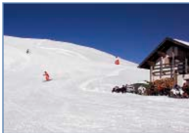
L'arrivo della pista

Da Cima Tognola, punto più alto della ski area, si gode di un panorama unico a 360°: gran parte della Catena delle Pale ed altri gruppi dolomitici tra cui la Marmolada.