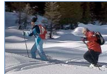
Escursione con le racchette da neve