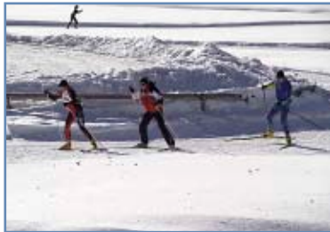
Centro fondo di San Martino

Situato ai margini del paese, il centro fondo dispone di tre anelli che si snodano nell'ambiente del biotopo Pra' delle Nasse, pregevole zona palustre caratterizzata da boschetti di ontani ed innumerevoli ruscelli ghiacciati.