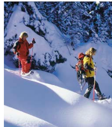
Escursione con le racchette da neve

Le Guide Alpine ogni giorno organizzano escursioni nelle zone più belle: dall'Altopiano delle Pale ai Laghetti di Colbricon, dalla Val Venegia ai Piani della Cavallazza e alla Foresta dei Violini.