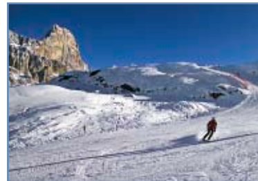
Pista “Fiamme Gialle”