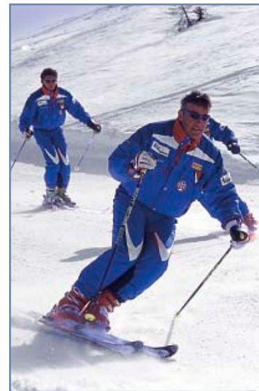
Maestri della scuola di sci