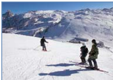
Pista "Cima Tognola"