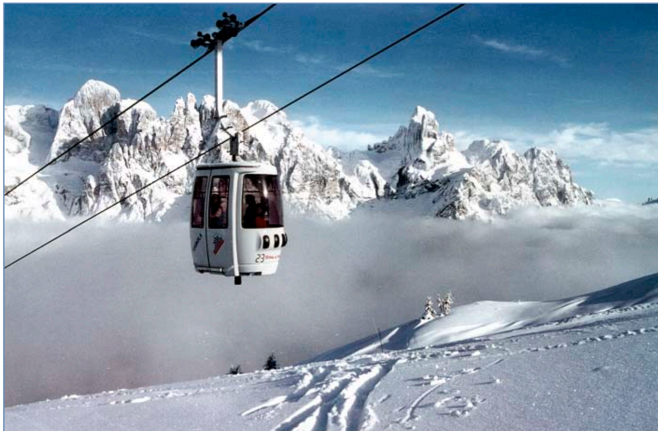
La cabinovia Tognola