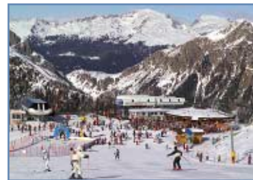
Pista “Baby Tognola”

La nuova sciovia ha velocità variabile per adattarsi ai diversi livelli dei principianti.