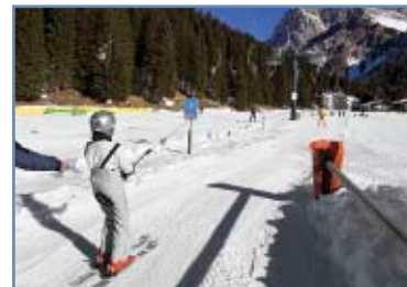
Sciovia “Pra’ delle Nasse”