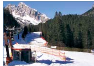
Arrivo pista “Bellaria”