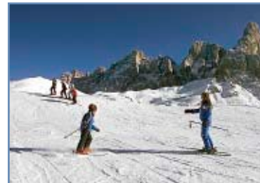
Pista “Rolle 2”